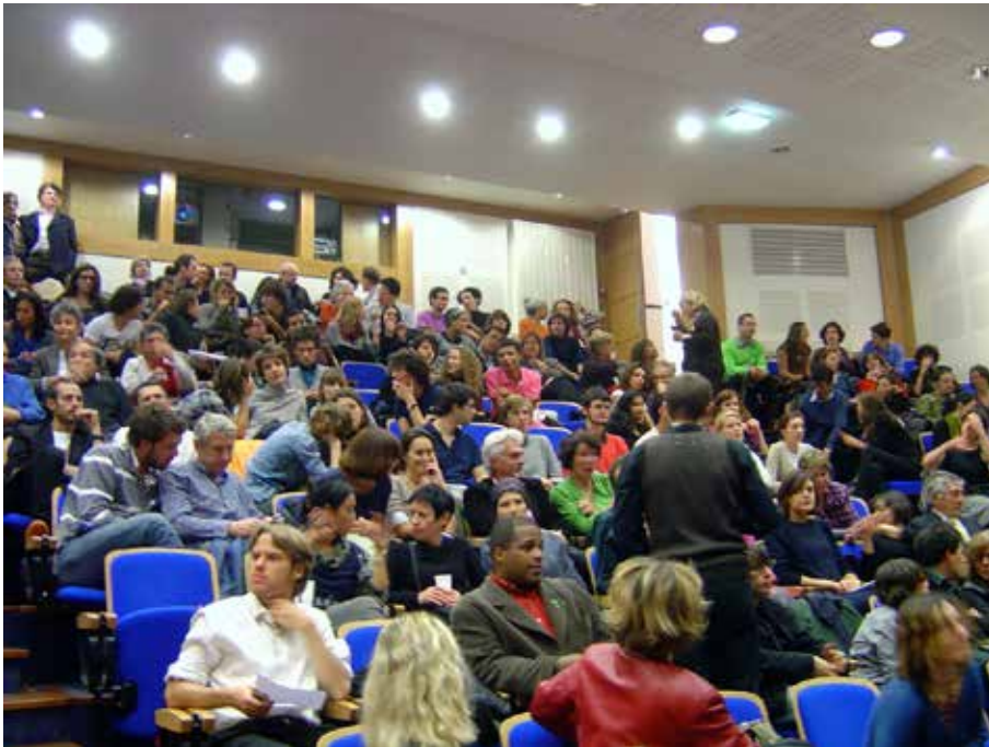
La « Nuit américaine », organisée le soir de l'élection présidentielle 2008.